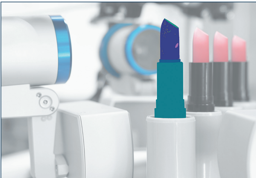
Нове революційне інспекційне рішення для помад на основі ШІ

ШІ допомагає усунути велику частину цих потенційних дефектів. Система виробництва групи SEA Vision (спільна розробка команд SEA Vision і ARGO Vision) використовує семантичну сегментацію зон губної помади (наприклад, основна частина, кінчик, шийка, механізм тощо) для